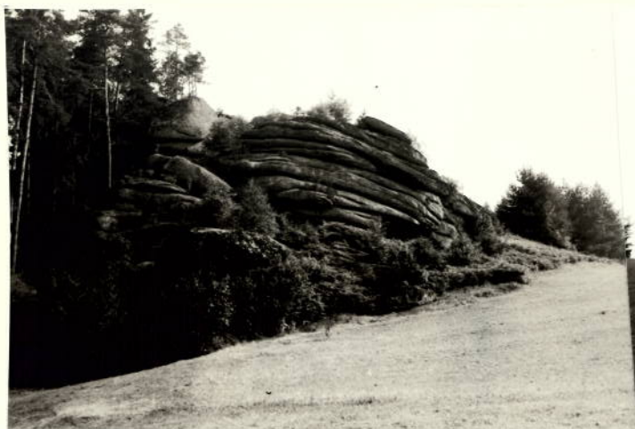
GRUPPE 1 AUS SUDWESTEN