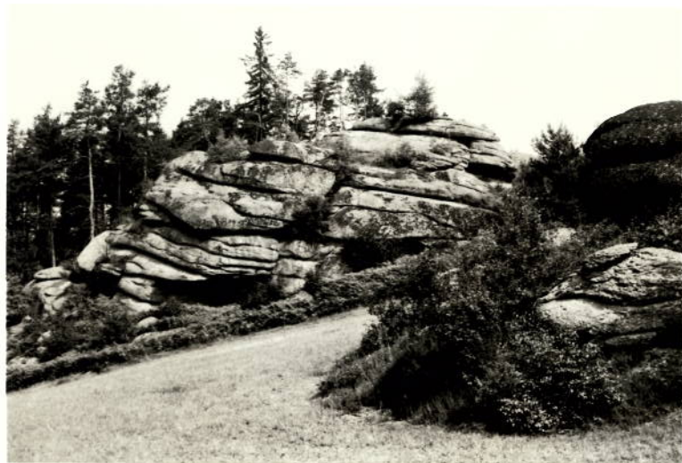
GRUPPE 1 AUS SO