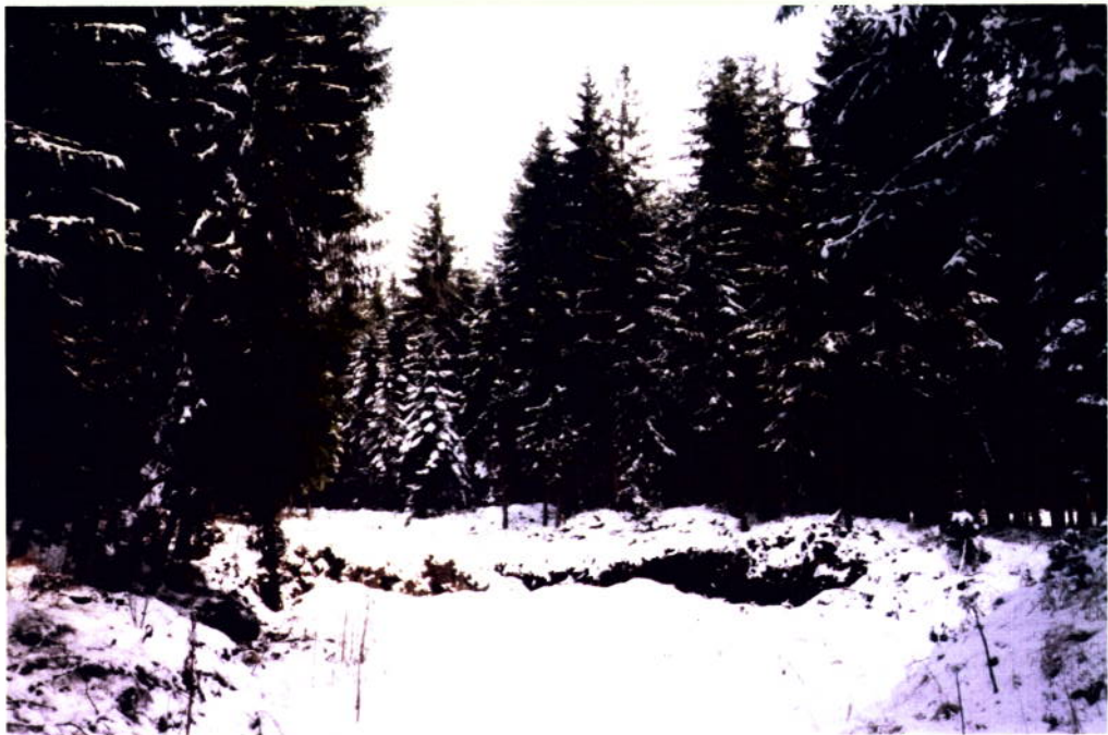
Photo 2, Torfstich