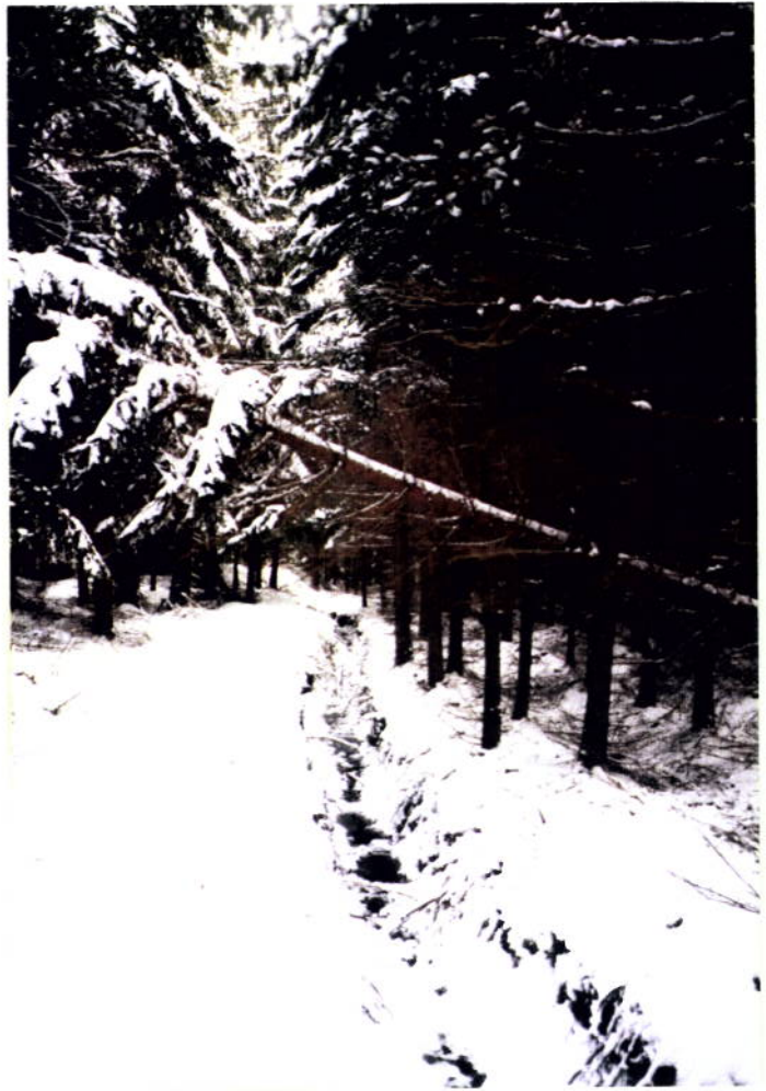
Photo 3 Graben