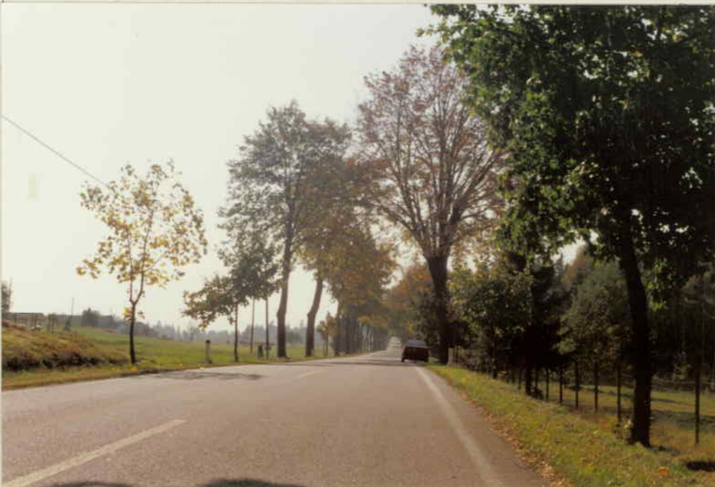
KM 41,0 (STANDORT FOTO 18) BUCKRICHTUNG SÜDEN