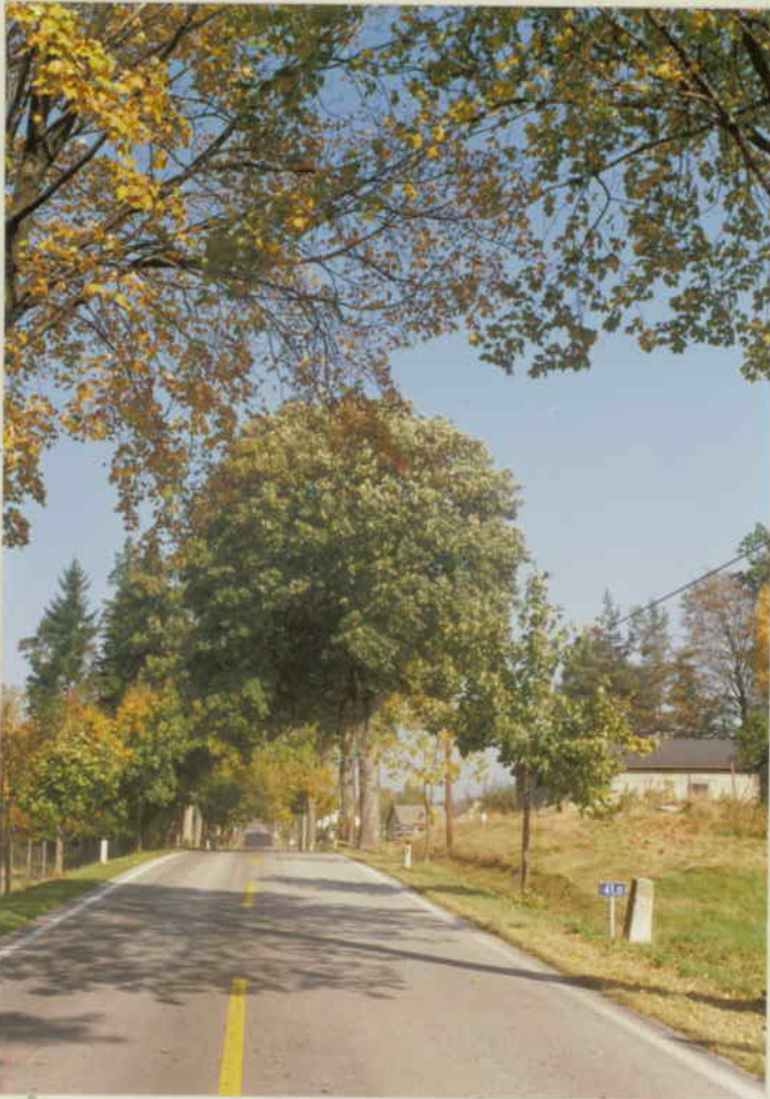
KM 41,0 BUCKRICHTUNG NORDEN (STAATSGRENZE)