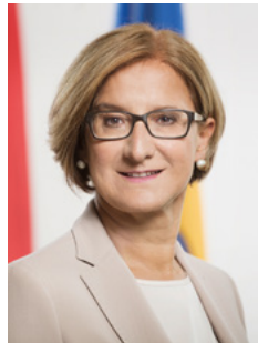
Johanna Mikl-Leitner Landeshauptfrau

Viele Jugendliche und natürlich auch ihre Eltern stellen sich die wichtigen Fragen: In welche Schule geht es nach der 8. Schulstufe weiter? Welche Berufe kann man erlernen? In diesem Alter gilt es weitreichende Entscheidungen zu treffen. Wichtig ist mir dabei, dass jedes Kind die vielfältigen Chancen und Möglichkeiten, die sich im Ausbildungsbereich bieten, für sich nutzen kann. Unser Ziel ist es, dass junge Menschen eine Ausbildung und einen Beruf finden, mit welchen Sie ein höchstmögliches Maß an Lebenszufriedenheit und Erfolg erreichen können. Der NÖ Talente Check, den wir gemeinsam mit der Wirtschaftskammer anbieten, ist dafür seit Jahren ein hilfreiches Instrument.